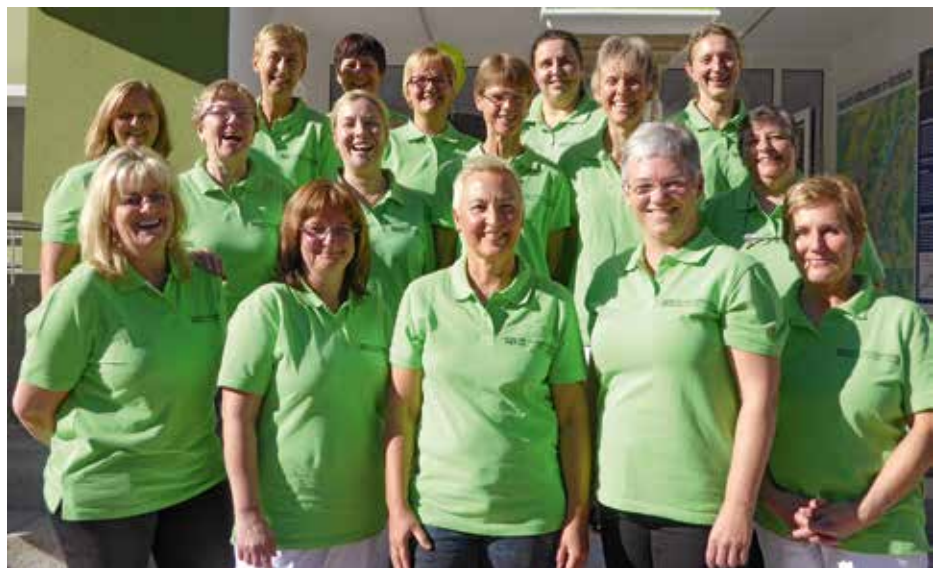
Die 16 starken Mädels des Sozialsprengels Kirchbichl-Bad Häring-Langkampfen

Schwarzenauer aus Kirchbichl kam dem Sprengel diesbezüglich sehr entgegen. Im Rahmen der Feierlichkeiten wurde auch dieses Fahrzeug von Pfarrer Stanislav Gajdos gesegnet. Be-