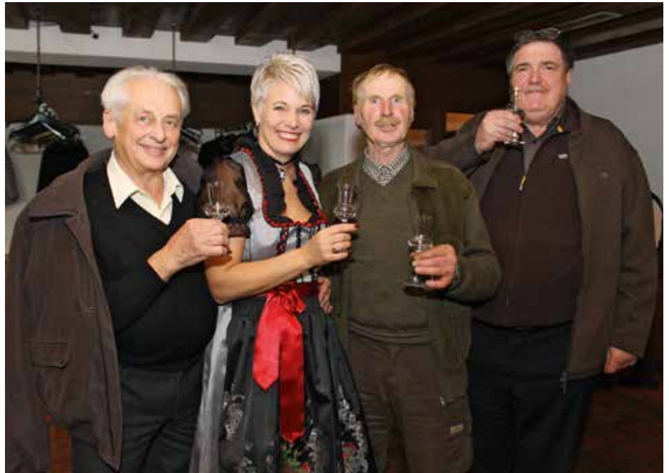
Mit einem „Gloriawasser“ wurden die Teilnehmer des Landeskrippentages begrüßt