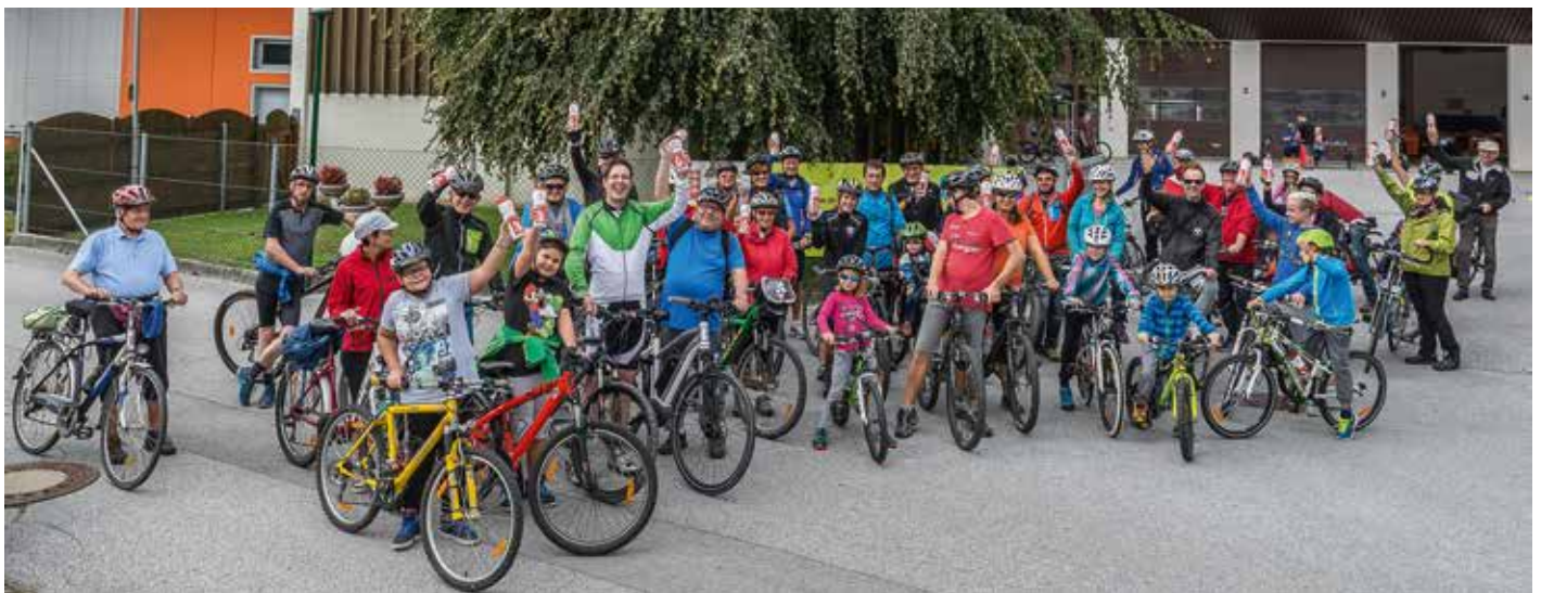
Gute Stimmung, zahlreiche Teilnehmer und perfekte Organisation zeichneten den ersten Kirchbichler Familienradwandertag aus