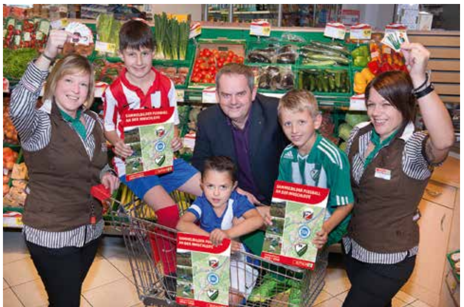
Das Team vom Spar-Markt Kirchbichl mit den Kids der SPG Kirchbichl/Langkampfen