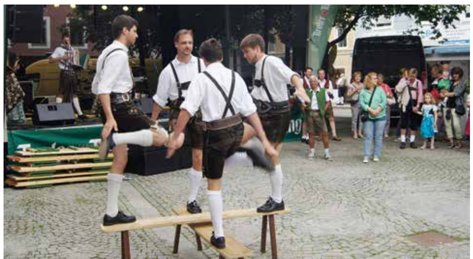
Beim „Bankerltanz“ sind neben Taktgefühl auch Akrobatik und Gleichgewichtssinn gefragt

Auftritt beim Kaiserfest in Kufstein Eine ganz besondere Ehre wurde den Volkstänzern sowie der Kinder- und Jugendgruppe im Juni mit ihren Darbietungen beim Kaiserfest in Kufstein zuteil. Am Festplatz bei der Volksschule wurden einige Tänze und Plattler aufgeführt, mit denen die Gäste begeistert werden konnten.