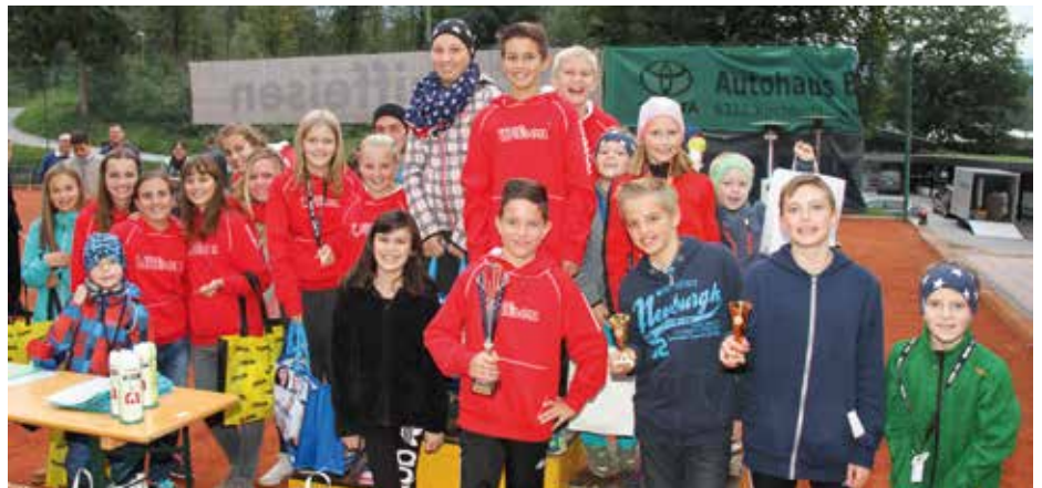
Viele Teilnehmer und große Begeisterung bei der Jungstarmeisterschaft