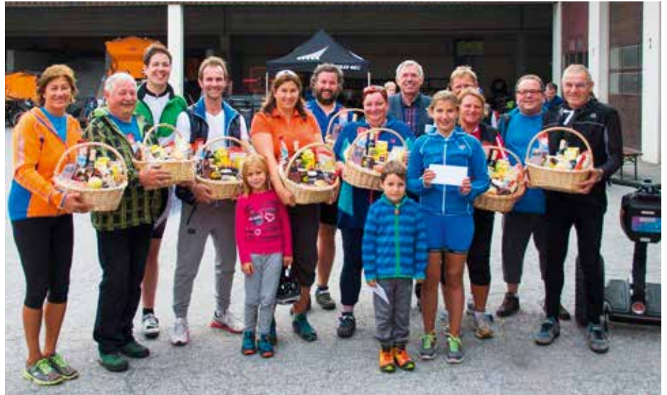
Die glücklichen Gewinner vom Fahrradwettbewerb bzw. Schätzspiel