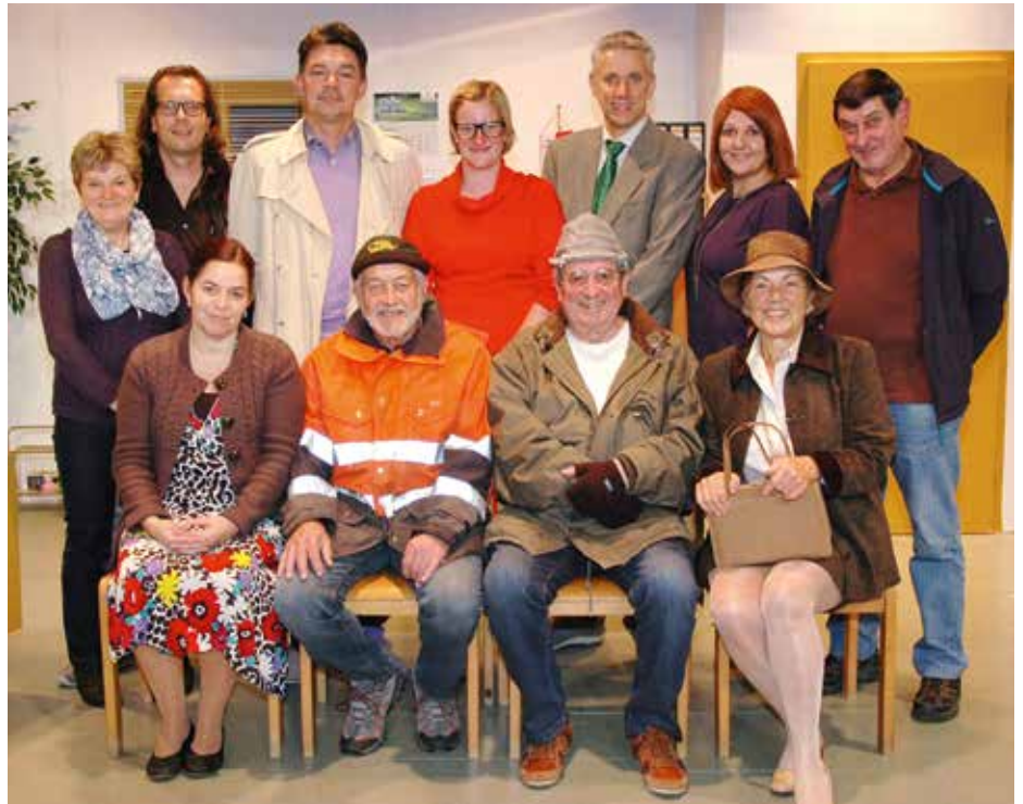
Das Ensemble des Herbststückes „Baby wider Willen“