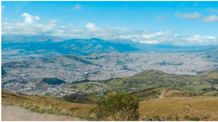
Blick auf Quito – Hauptstadt von Ecuador

bei uns selbstverständlich sind, haben mich tief berührt und gehören zu den prägendsten und emotionalsten Momenten meines Aufenthalts.