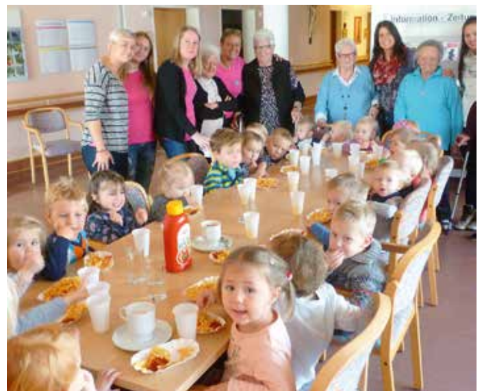
Große Freude herrschte über den Besuch der Kleinen im Wohn- und Pflegeheim

Zu Martini machten die Kinder wieder mit ihren selbstgebastelten Laternen den Sternen am Himmel Konkurrenz. Nach einem gemeinsamen Rundgang war für alle natürlich wieder für das leibliche Wohl bestens gesorgt.