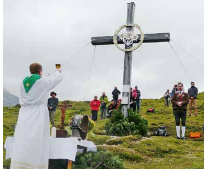
Das schöne Kreuz am Plumsjoch wurde von den Kirchbichler Trachtlern aufgestellt

Diese Messe wird nun alljährlich im Spätsommer stattfinden und all jene, die es heuer nicht geschafft haben, können sich diesen Termin Ende August fürs kommende Jahr vormerken.