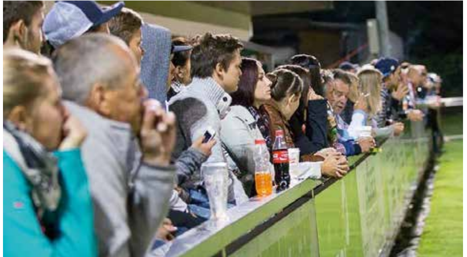
Leider zu selten – viele Zuschauer unterstützen tatkräftig unser Team

Die Vereinsverantwortlichen möchten sich auch auf diesem Wege bei der Firma SPAR herzlichst bedanken! Und das Beste dabei: Der Sammelboom von Jung und Alt bestätigt den Erfolg!