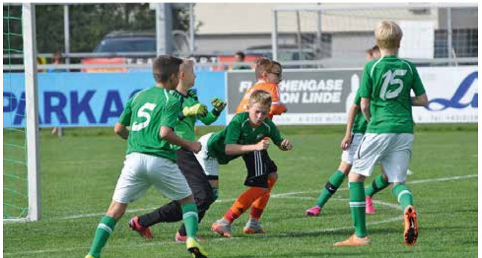
Voller Einsatz auch im Nachwuchsbereich!