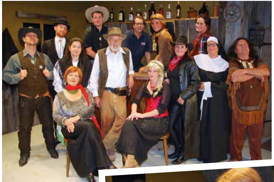
Das Ensemble des Stückes „Die Western Schwestern“

Zum Stück: Die Beerdigung eines schlitzohrigen Revolverhelden ist Anlass für allerlei Verwirrung in einem kleinen Prärie-Städtchen. Saloon-Wirtin Molly McDonald, Tochter des Verstorbenen, kann die Testaments-eröffnung kaum erwarten. Aber auch Lassie Laroque, Betreiberin eines anrühigen Etablissements in New Orleans, hat sich aus selbigem Grund auf den Weg in das gottverlassene Nest gemacht. Wie es dabei weitergeht, können Sie bei den Aufführungen im Pfarrsaal von Kirchbichl am 15., 21.,