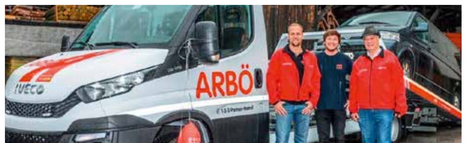
ARBÖ Gruppe Wörgl

„Mehr Lebensqualität durch weniger Verkehr“ – so lautete am 17. September das Motto in der Gemeinde Kirchbichl. Der „autofreie Tag“ lockte wieder zahlreiche Besucher zum Gemeindebauhof. Leider konnte der Familienradwandertag witterungsbedingt nicht durchgeführt werden. Stattdessen wurden fleißig Segways getestet und Fahrradchecks durch-