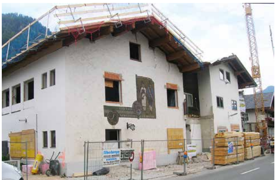
Die Sanierungsarbeiten sind bereits voll ange laufen

Anfang August wurde mit den Baumeisterarbeiten – welche von der Fa. Buchauer & Strasser (Wörgl) ausgeführt werden – begonnen. Die Zim-