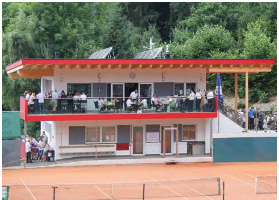
Das neue Tennis-Clubheim