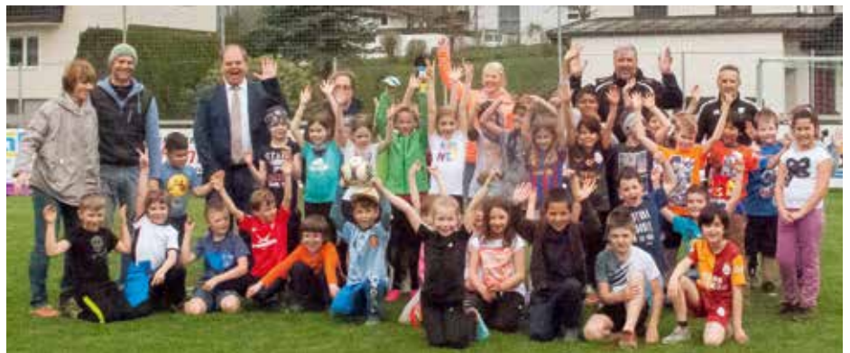
Die Aktion des ÖFB verursachte große Begeisterung bei den teilnehmenden Schulkindern

Die Aktivitäten beschränken sich nicht nur auf Sport, auch Integration ist wichtig. Vormittags wird in der Volksschule gelernt und an ein bis