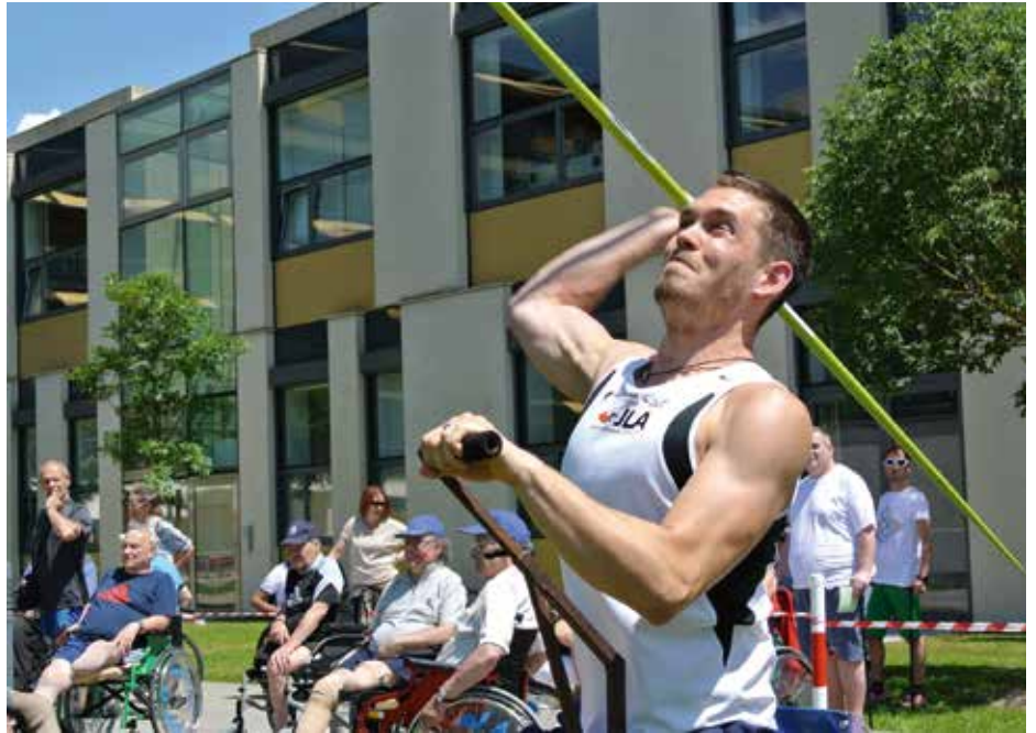
Viel Ehrgeiz, aber auch Spaß stehen bei den Wettkämpfen im Vordergrund