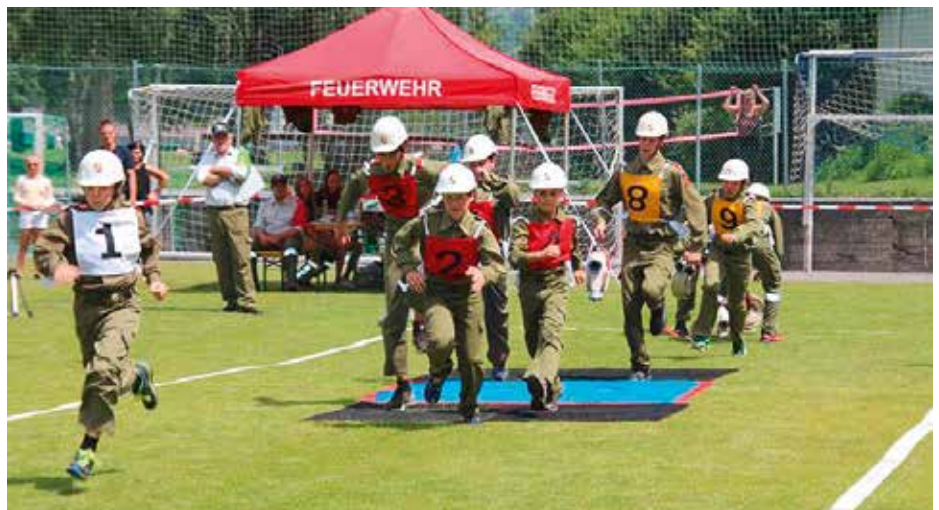
Voller Einsatz beim Feuerwehrynachwuchs

Am 25. Juni nahm eine Doppelgruppe der Jugendfeuerwehren von Kastengstatt und Kufstein am Landesjugendbewerb und am Landeszeltlager in Prutz (Bezirk Landeck) teil. Mit einer hervorragenden Zeit von 59,99 Sekunden und 20 Fehlersekunden erreichte man den 9. Platz von 33 teilnehmenden Gruppen in der Kategorie Bronze. Als Bezirkssieger konnte man sich für den Tirol-Cup qualifizieren, wo alle Bezirkssieger im Ko-System gegeneinander antreten.