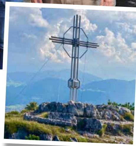
Gipfelkreuz Hundsalmjoch, Meisterstück von Herrn Martin Flörl; (Foto: Martin Flörl)

Schule Wörgl somit eine solide Berufsgrundbildung und entlässt nach der erfolgreichen Absolvierung ausgezeichnet vorbereitete zukünftige Lehrlinge für unsere Lehrbetriebe. (Text: Martina Hartl, BEd, Schulleiterin in PTS Wörgl)