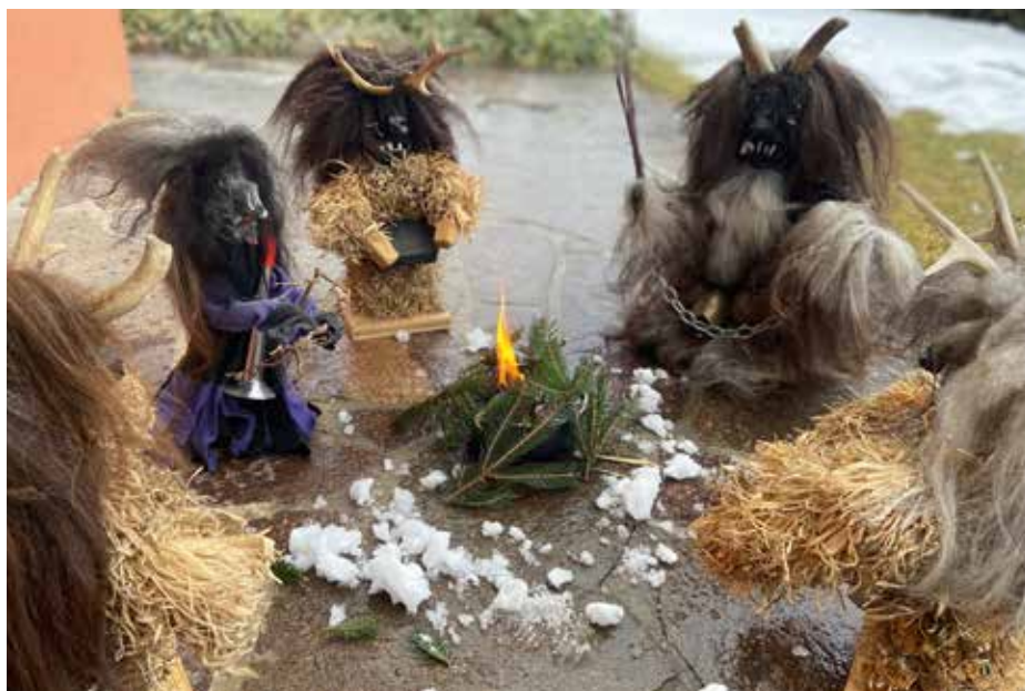
Corona-bedingt konnten im Jubiläumsjahr nur die im Eigentum der Pass befindlichen Miniaturperchten ausrücken

Aufgrund der Corona Pandemie mussten die Saison 2020 sowie die Jubiläumssaison 2021 abgesagt werden. Dennoch standen auch in dieser Zeit zahlreiche Tätigkeiten, wie etwa die Aktion „Sauberes Kirchbichl“, der Kirchbichler Summa Treff, Proben sowie interne Vereinsaktivitäten auf dem Programm.