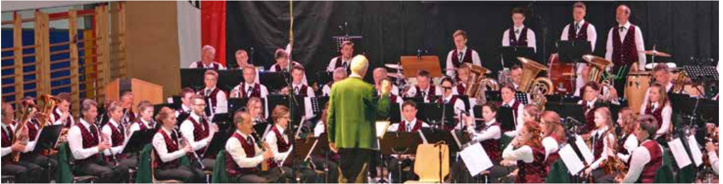
Die BMK Kirchbichl wird nach zweijähriger Pause für ihr Frühjahrskonzert wieder die Bühne im Turnsaal der Volksschule betreten.

Die musikalische Pause war auch für die Bundesmusikkapelle Kirchbichl eine lange.