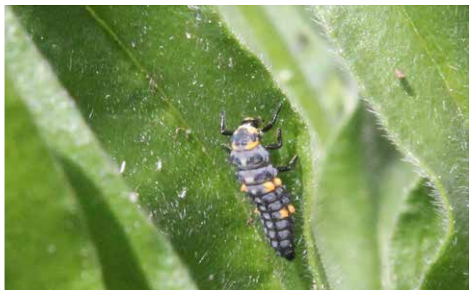
Marienkäfer-Larve auf der Jagd nach Blattläusen.

Fachmännisch als sogenannte „Grundstoffe“ bezeichnet, kann man diese Pflanzenschutzmittel auch mit dem Begriff „Hausmittel“ zusammenfassen. Es handelt sich um Dinge wie Backpulver, Brennessel, Molke und sogar Bier. „Für die menschliche Gesundheit ist die Anwendung die-